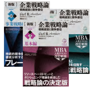
ジェイB.バーニー/ウィリアム S.ヘスタリー著 2021年、ダイヤモンド社

ジェイ B. バーニーは、組織の内部資源（リソース）を競争優位の源泉として強調するRBV（リソース・ベースト・ビュー）の研究で有名な戦略理論家です。本研修では経営戦略の基本から実践まで、バーニーが説くVRIOフレームワークを用いて整理をしながら学びます。学んだ知識を講師・受講者とのディスカッションを通じて深め、自組織の優位性や戦略を考え抜くことで、すぐに現場で活用できる学びへと昇華させます。